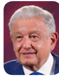
Andrés Manuel López

Y dijeron que a estas alturas y a solo unos días de las elecciones ya es prácticamente imposible controlar esta situación y se prevé que haya una jornada violenta en las próximas elecciones, toda vez que vivimos en un país donde el gobierno está ausente y los criminales están en posibilidades de hacer de las suyas antes y durante el día de las elecciones, lo cual amenaza con tornarse en un panorama grave.