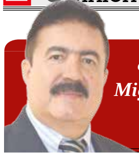
Columna de Miguel Ángel Vega C.