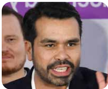
Jorge Álvarez Maynez