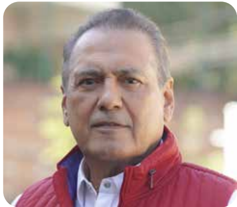
Manlio Fabio Beltrones