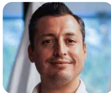
Luis Donaldo Colosio Riojas